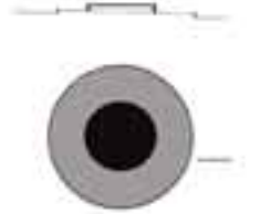
Liikenneympyrä, hiottu musta betoni.