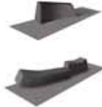
Veistokselliset penkit ja skeittiramppi. Hiottu musta betoni, joissa vahvistetut reunat.