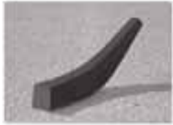
Veistos ja "Graafinen betoni" -menetelmällä toteutettu aukio