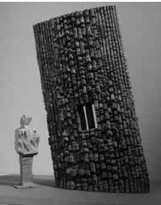
1 Federico Assler