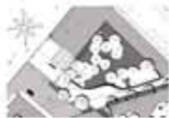
Pitkä tukimuri jatkuu veistokseksi