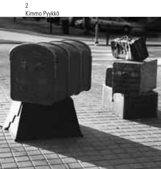
2 Kimmo Pyykkö