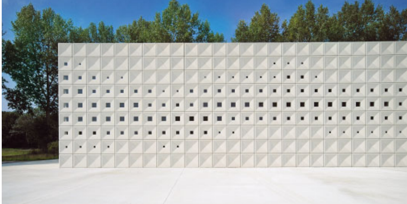
4 Heimolen krematorio.