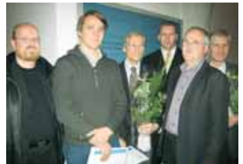
8, 9 Ehdotuksen "Kiviset ja Soraset" tekijä on VVO Rakennuttaja Oy pääsuunnittelijanaan Arkkitehtitoimisto A-Konsultit Oy: