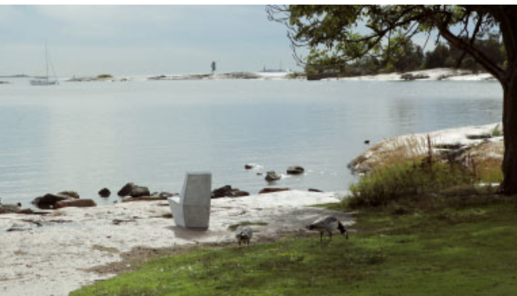
Samu Viitanen 1