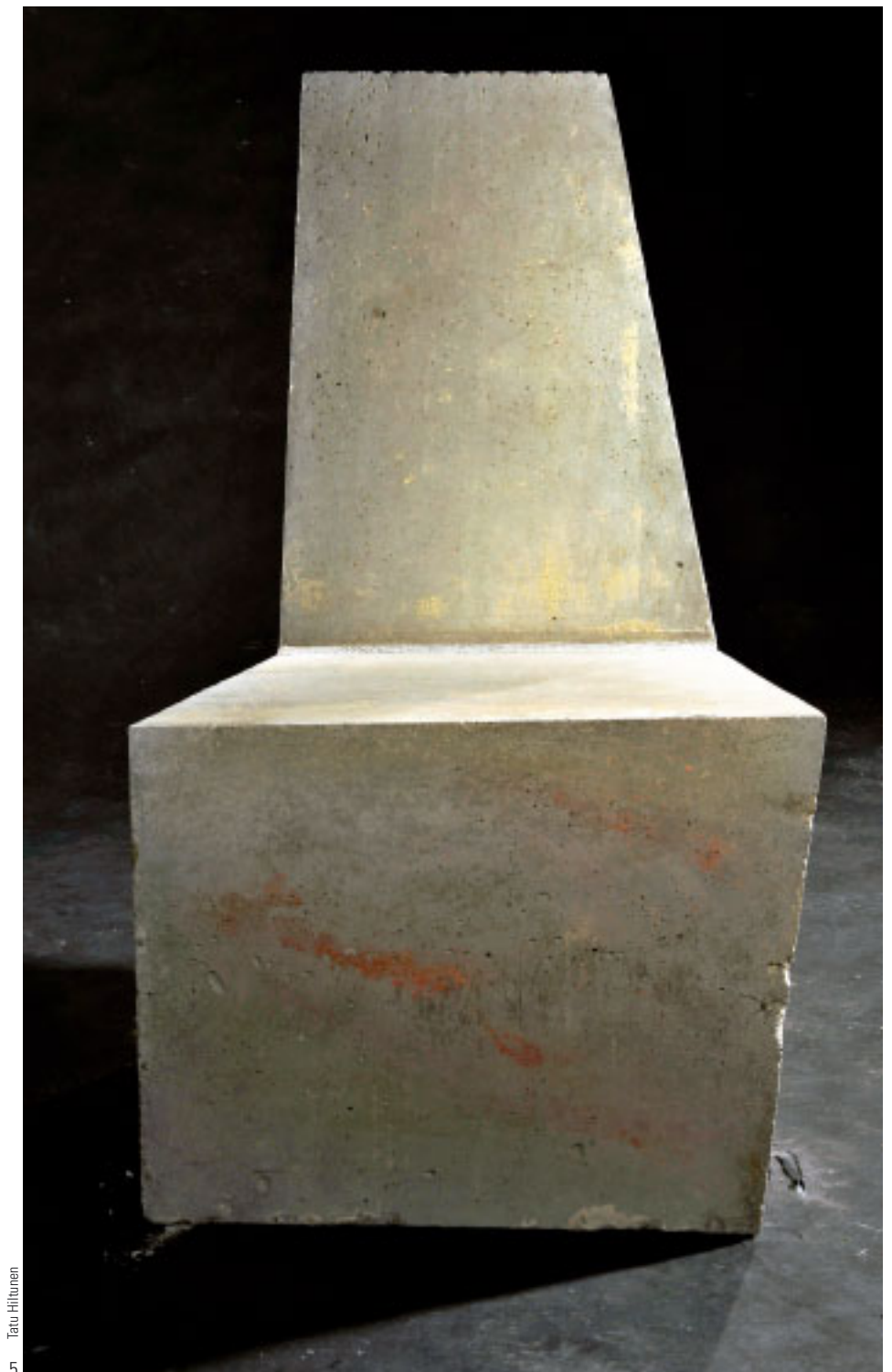
Tatu Hiltunen 5