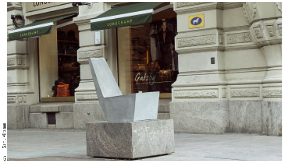
Samu Viitanen 6