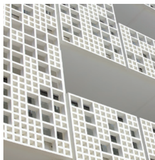
20 Länsisatamankatu 23