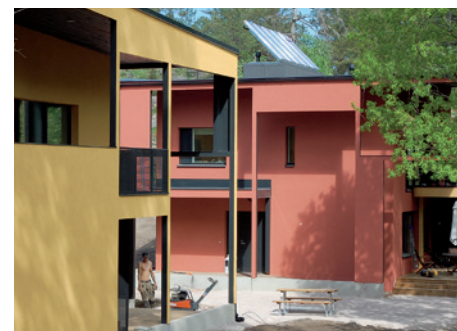
28 Oravarinteen passiivitalot