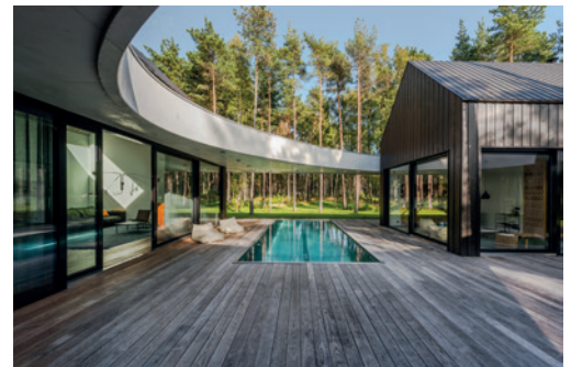
20 Talo Viimsissä