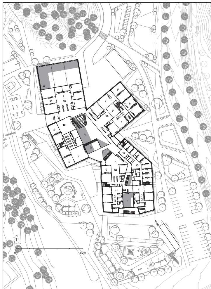
6 2. kerros