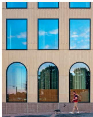
12 Scandic Grand Central Helsinki