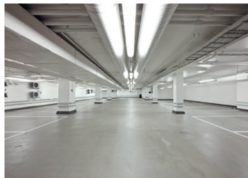
46 Uusi laittioiden pinnoitusohje