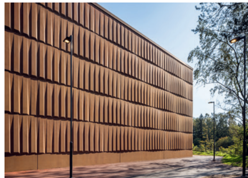
10 Namika Areena