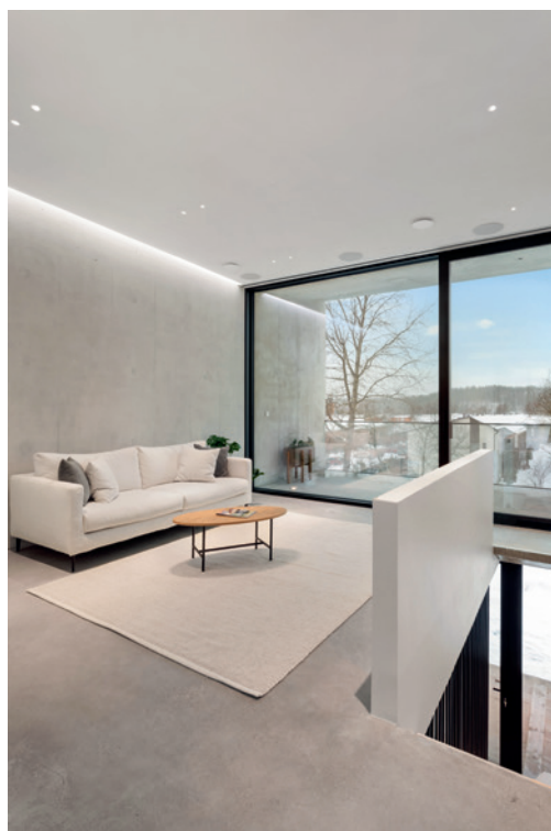
8 Asunto Oy Panorama