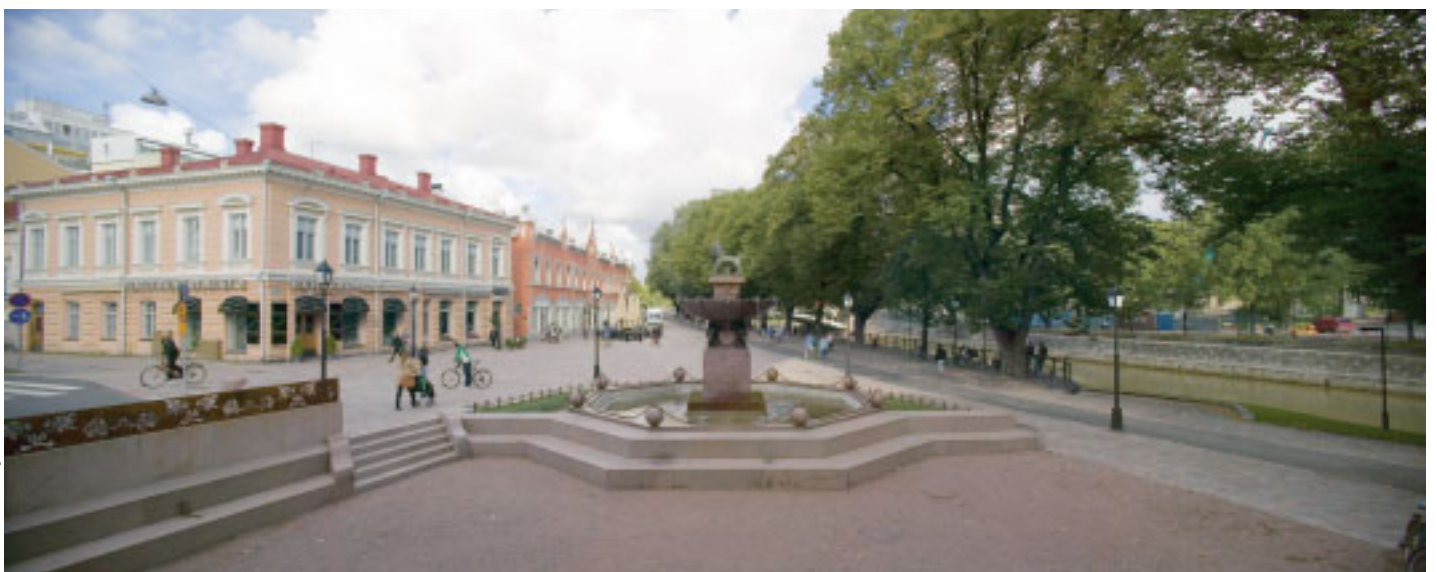
5 Vuonna 1924 rakennetun suihkulähteen perustukset uusittiin. Alueen tasoerot ratkaistiin uusilla muuri- ja porrasratkaisulla.