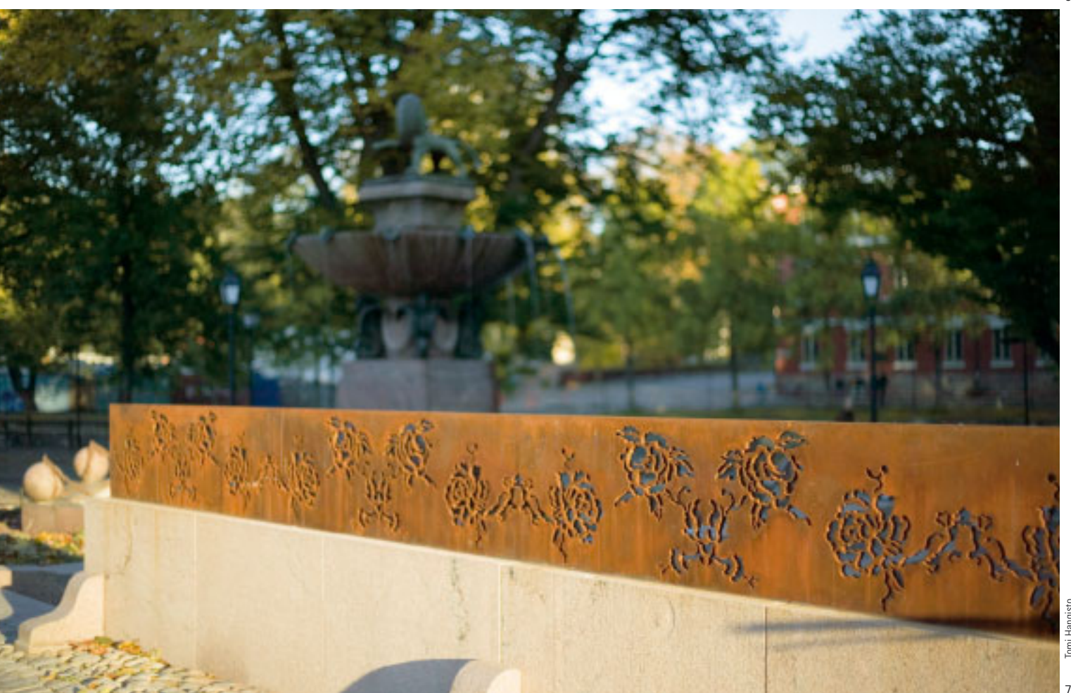
Tomi Hangisto 7, 8