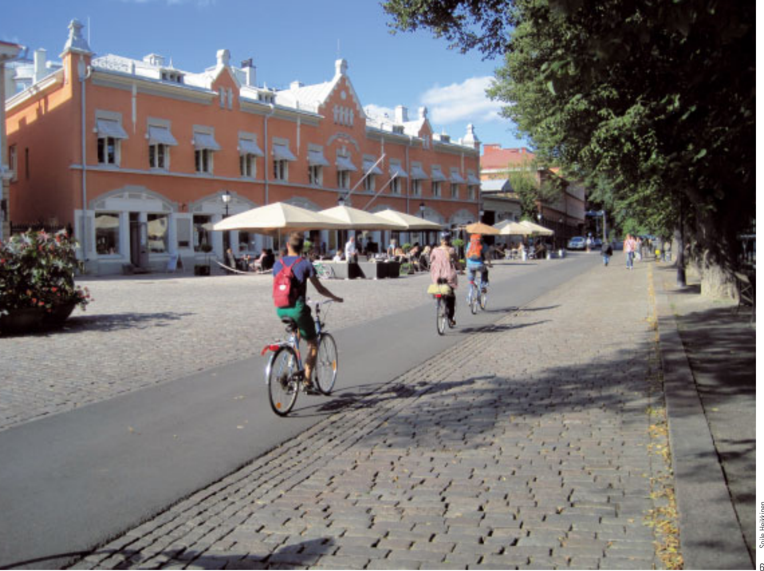
Soile Heikkinen 6