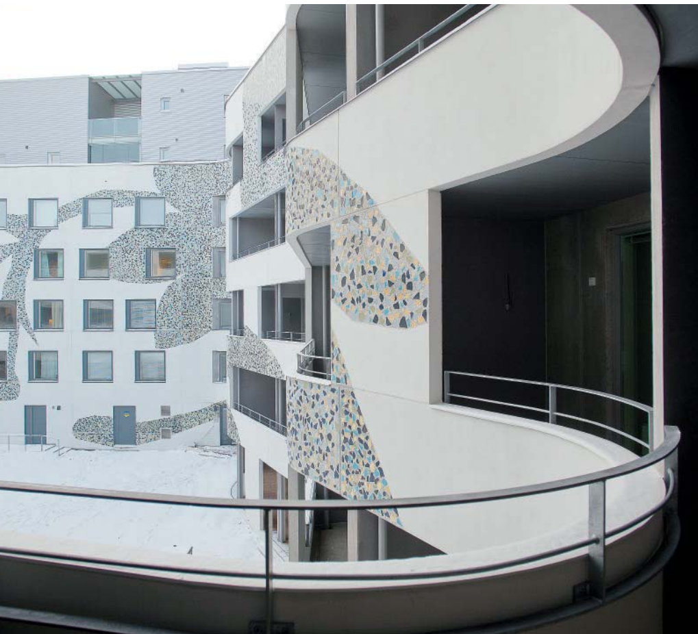
Armo de la Chapelle