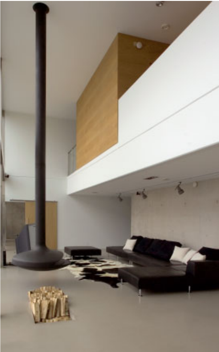
16 Kairdo Haagen