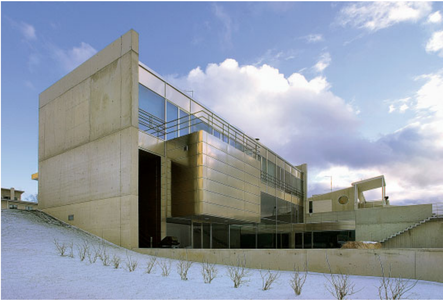
15 Kairdo Haagen