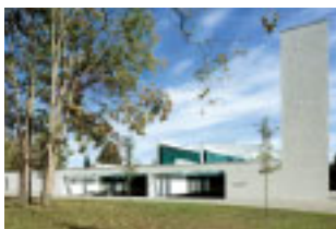
Pyhän Laurin kappeli, Vantaa