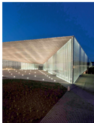
10 ERM Tartto