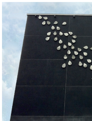
22 Imatran teatteritalo