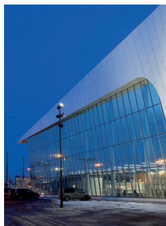
10 Länsiterminaali 2