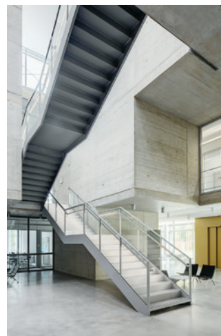
36 Center for Systems Biology Dresden