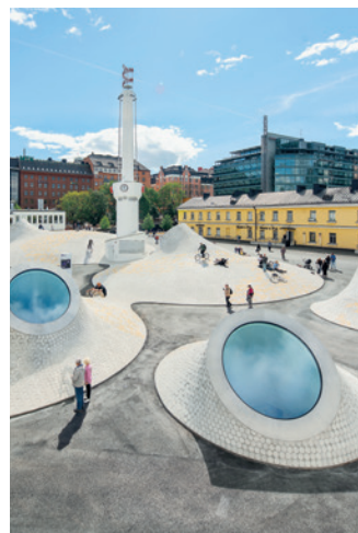
16 Amos Rex