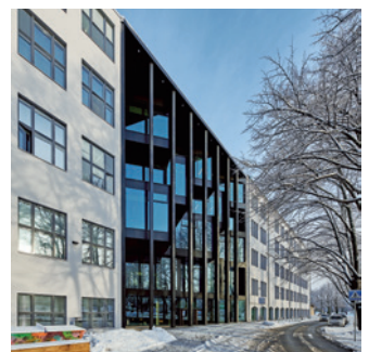
68 Viron taideakatemia EKA