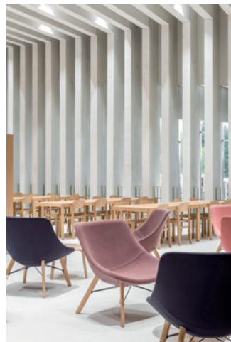
8 Kirkkonummen pääkirjasto Fyyri