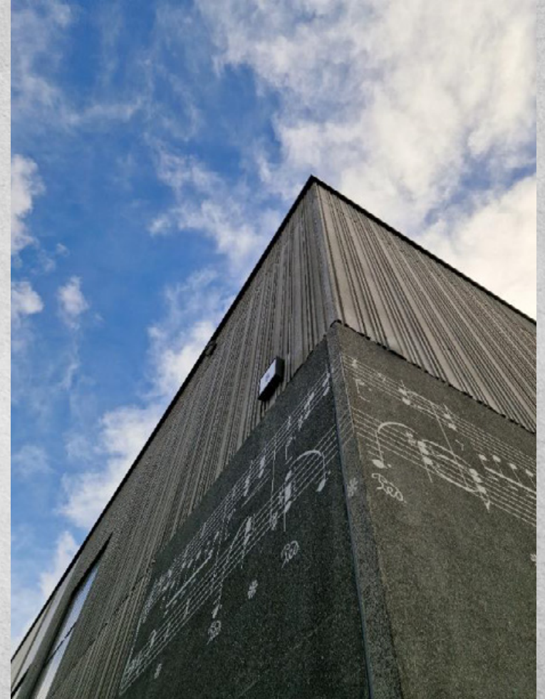
Kuva: Annika Jaakkola